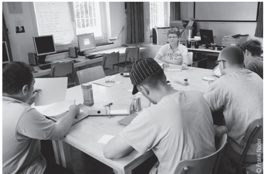
Für die Benutzung des Computers werden strikte Regeln aufgestellt (hier: Strafanstalt Schöngrün SO).

BiSt hat aus Sicht der Evaluation die Pilotphase gut genutzt. Gemachte Erfahrungen können nun bei der angelaufenen Ausdehnung von BiSt helfen, den mit ihr verbundenen fachlichen und organisatorischen Herausforderungen zu begegnen. Trotz grösserem Umfang und Komplexität von BiSt soll etwa das pädagogische Anliegen nicht aus den Augen verloren werden. Insgesamt bietet BiSt heute die Möglichkeit, den Auftrag des neuen StGB zu erfüllen. Das Bildungskonzept von BiSt – Bildungsangebot in den Anstalten, Lehrplan, Fachstelle, zentrale Rekrutierung, Führung und Weiterbildung der