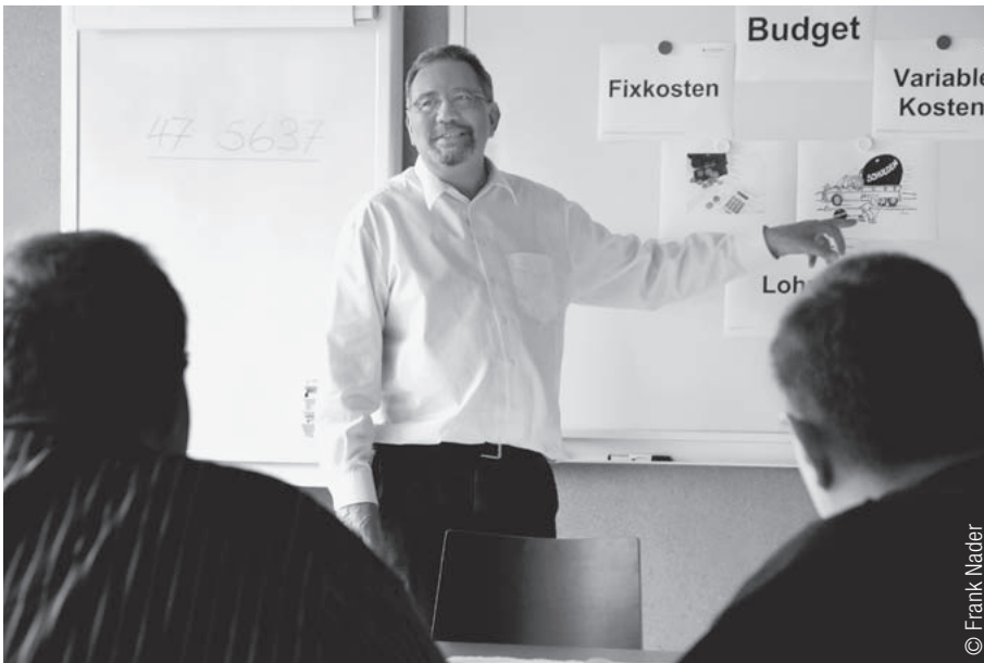
Unterrichtsstunde im Massnahmenzentrum Bitzi SG (Projekt BiSt).