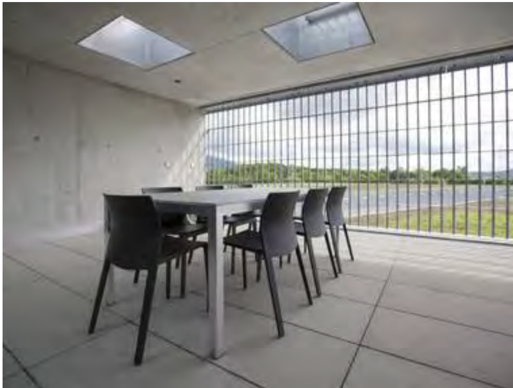
Justizvollzugsanstalt Schachen in Deitingen bei Solothurn (Archiv)

Ob Lesen und Schreiben lernen, ob Vorbereitung auf eine Prüfung - das schweizerische Programm Bildung im Strafvollzug (BiSt) ermöglicht Gefangenen, ihre schulischen Lücken zu schliessen. Damit verbessern sich die Aussichten für das Leben nach der Entlassung.