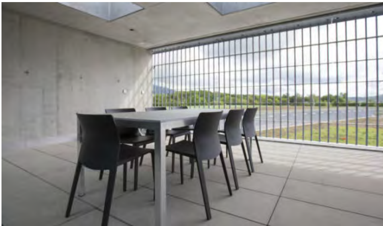
Justizvollzugsanstalt Schachen in Deitingen bei Solothurn (Archiv) (Keystone)