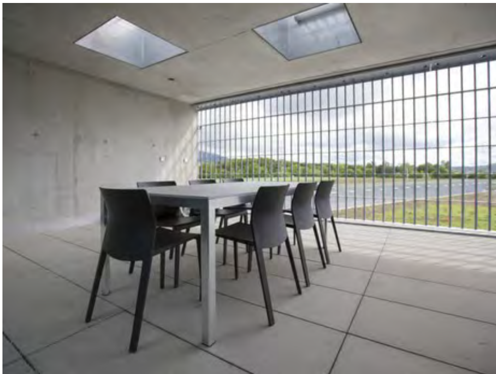
Justizvollzugsanstalt Schachen in Deitingen bei Solothurn (Archiv)