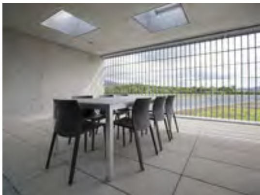
Justizvollzugsanstalt Schachen in Deitingen bei Solothurn (Archiv).

Ob Lesen und Schreiben lernen, ob Vorbereitung auf eine Prüfung - das schweizerische Programm Bildung im Strafvollzug (BiSt) ermöglicht Gefangenen, ihre schulischen Lücken zu schliessen. Damit verbessern sich die Aussichten für das Leben nach der Entlassung.