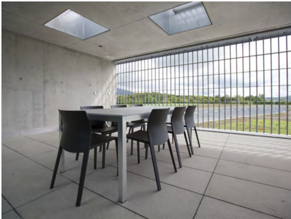
Justizvollzugsanstalt Schachen in Deitingen bei Solothurn (Archiv)