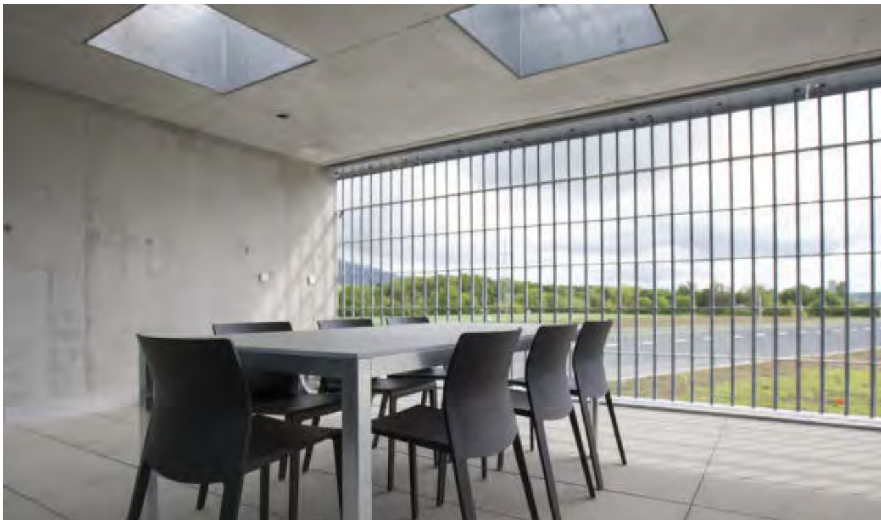
Justizvollzugsanstalt Schachen in Deitingen bei Solothurn (Archiv)

Ob Lesen und Schreiben lernen, ob Vorbereitung auf eine Prüfung - das schweizerische Programm Bildung im Strafvollzug (BiSt) ermöglicht Gefangenen, ihre schulischen Lücken zu schliessen. Damit verbessern sich die Aussichten für das Leben nach der Entlassung.