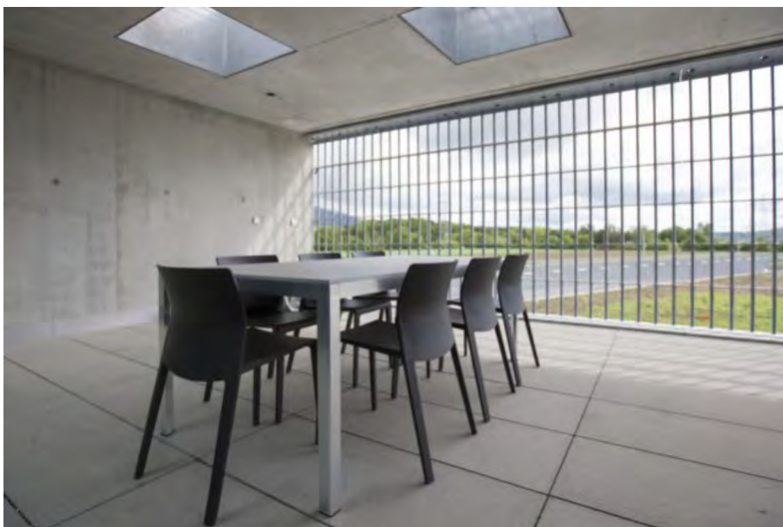
Justizvollzugsanstalt Schachen in Deitingen bei Solothurn (Archiv)